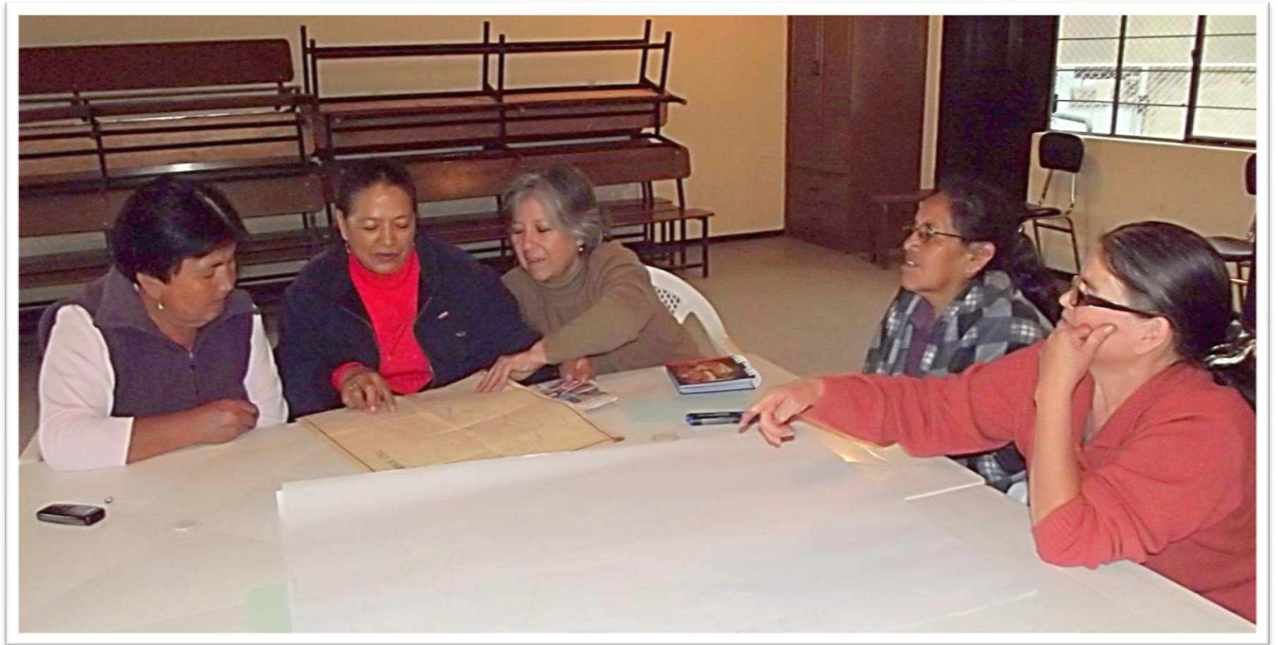
Foto N° 1. Participantes en uno de los talleres de memoria realizados en la casa barrial de la calle Guadalupeana