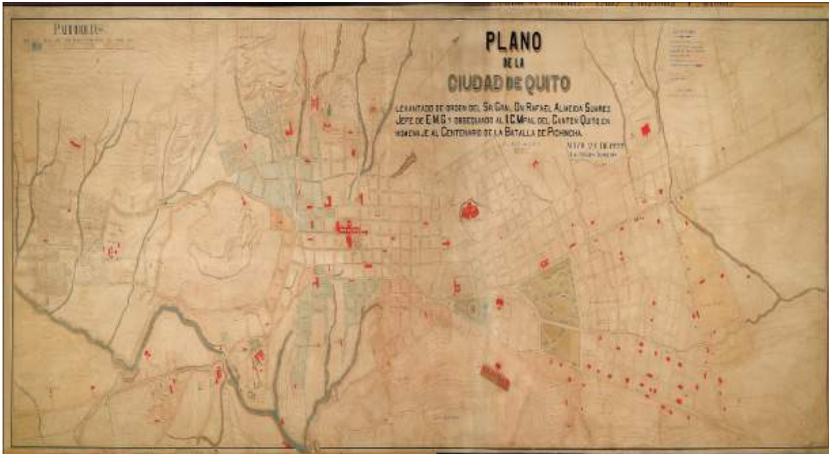
Mapa N°3. Plano de la ciudad de Quito en 1922

Fuente: Damero. Plano de Quito en el que se puede identificar los sectores de El Dorado cerca al hospital civil de la época y del cerro Itchimbía, aún sin poblar.