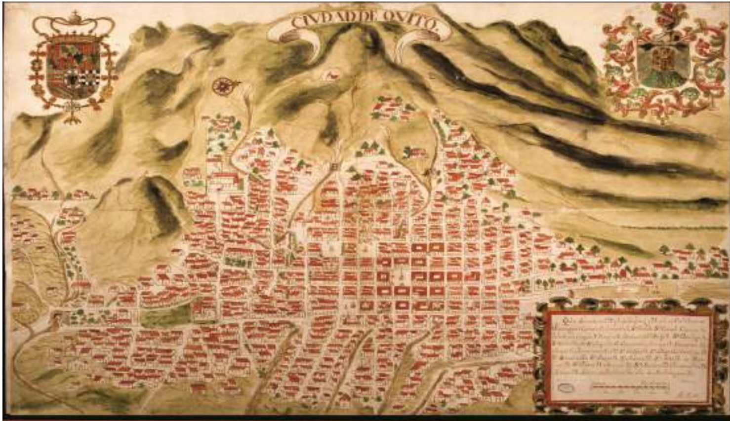
Fuente: Damero. Mapa de Quito en 1903, en el cual se puede observar una población a las faldas del Pichincha en medio de varias vertientes entre ellas el río Machángara.