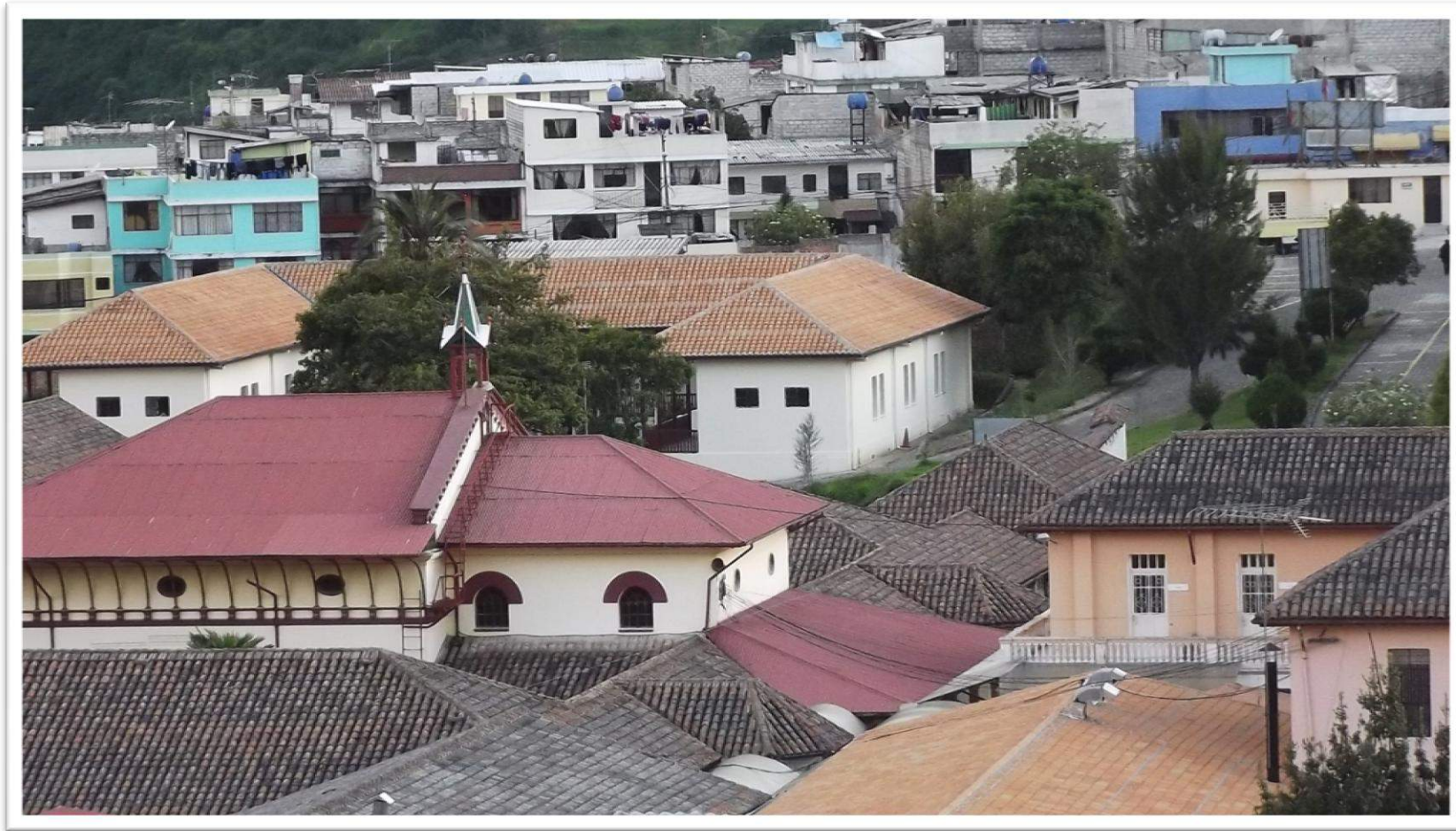
Foto N° 2. Panorámica actual del barrio San Pedro y San Pablo en el sector la Vicentina Baja