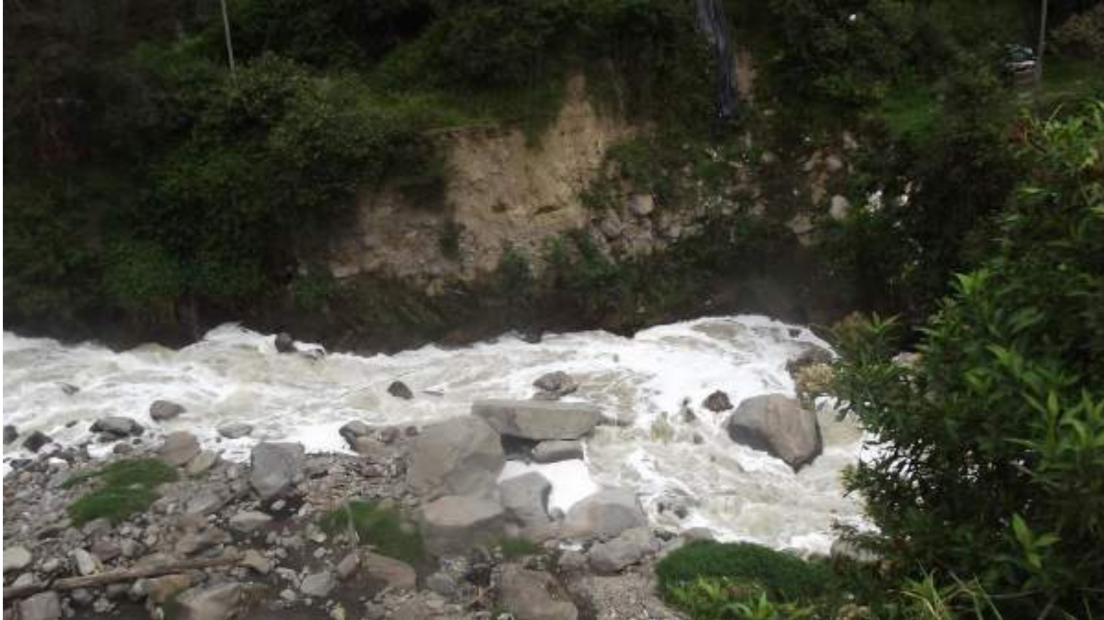
Foto N°3. El río Machángara a su paso por el sector de la Vicentina Baja