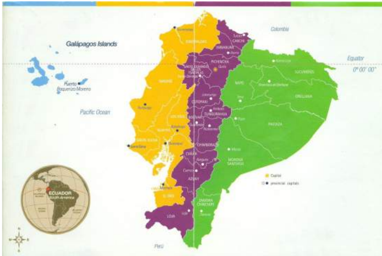
Mapa N° 2. Ubicación del Ecuador en el continente Americano

Se puede diferenciar las tres zonas que prevalecen en el Ecuador, Costa (color amarillo), Sierra (color violeta) y Amazonía (color verde).