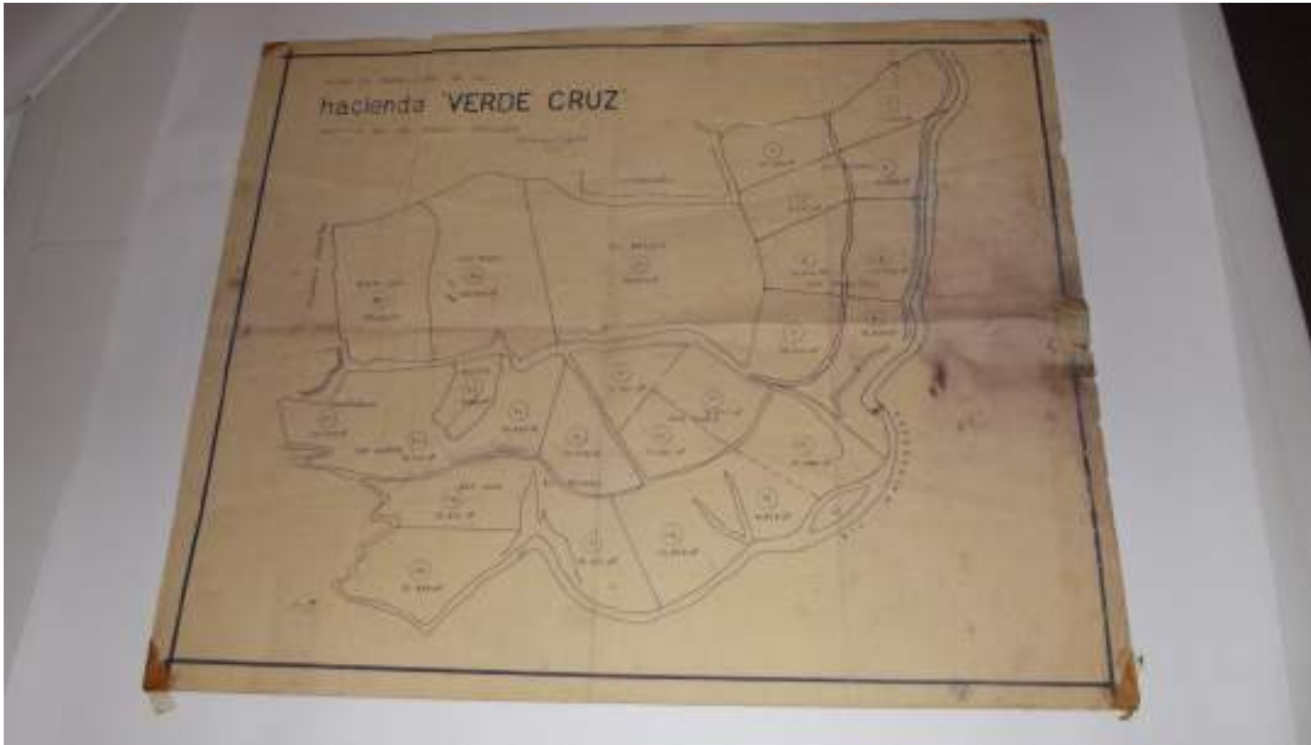
Gráfico N°2 Plano de la hacienda Verde Cruz.