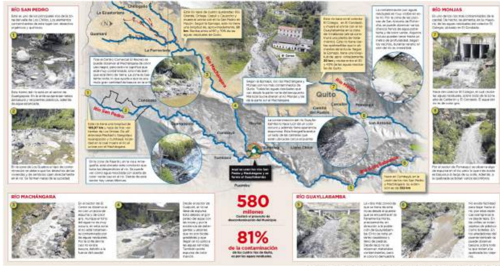
Gráfico N° 1. Principales ríos en la ciudad de Quito

Fuente: Según la EMAPS, el río Machángara y el río Monjas son los más contaminados de la ciudad. Esta imagen se puede visualizar mejor en el siguiente link: Principales ríos en la ciudad de Quito.