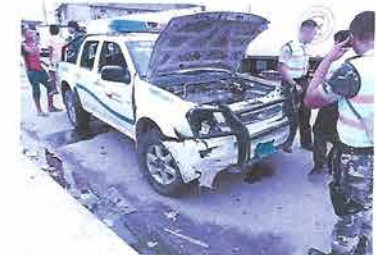
En la Isla Trinitaria (en el sur de Guayaquil) dos policías que se movilizaban en un patrullero cayeron con el vehículo al estero del Muerto, cuando perseguían a los asaltantes de un bus ayer, a las 15:30. Los gendarmes resultaron ilesos.