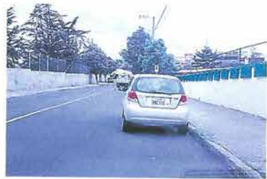
En la avenida Quis Quis, en la zona alta de Ambato, la falta de parqueaderos públicos motiva a los conductores a estacionarse en áreas prohibidas, incluso junto al Comando de Policía de Tungurahua. Hay riesgo de accidentes de tránsito.