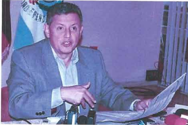
El presidente del Banco Central del Ecuador, Pedro Delgado, ofreció ayer una rueda de prensa en Guayaquil.

El organismo presentó ante la Fiscalía una denuncia contra varios deudores por haberse comprometido a pagar sus deudas con firmas falsificadas, lo que perjudicó al negocio de la banca cerrada.